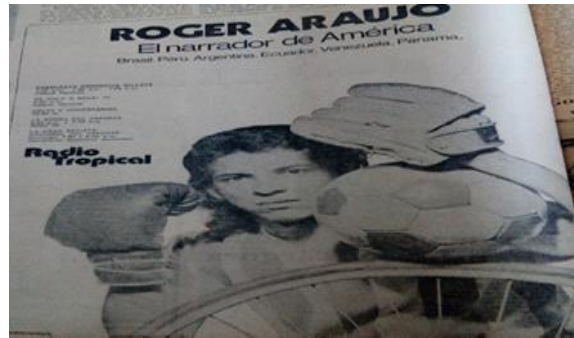
Imagen No 4. Publicidad deportiva de la Radio.