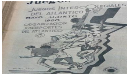
Imagen No 5. Publicidad de Torneos intercolegiales. Fuente: Juegos Intercolegiales del Atlántico, “Juegos Intercolegiales”, El Diario del Caribe, Barranquilla, 22 de mayo, 1980, 12.

La imagen No. 5, también transmite esa figura del hombre siendo el centro de atención a la hora de los deportes, mostrando en ella como el ajedrez, atletismo, futbol, beisbol, baloncesto. Ahora bien, el punto que se busca con estas imágenes es cuestionar por qué en ninguna de las publicidades acerca del deporte en la prensa local no se muestra al género femenino, aunque esta participe en el ajedrez, baloncesto y atletismo. Estas imágenes son unas de las muchas que tienen el mismo formato androcéntrico muy remarcado.