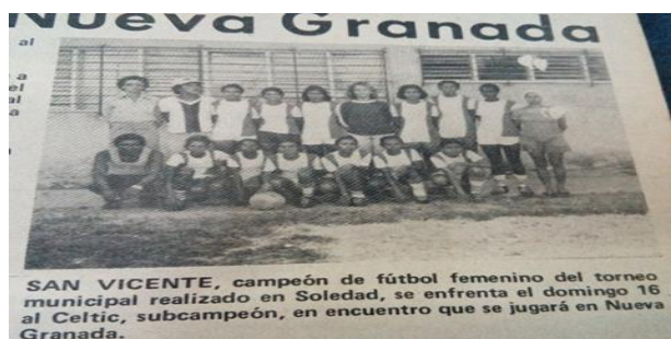
Imagen N 13 , jugadoras de futbol, Fuentes: Futbol Femenino el domingo en la cancha Nueva Granada. El Diario del Caribe, 9 de marzo de 1977,9.