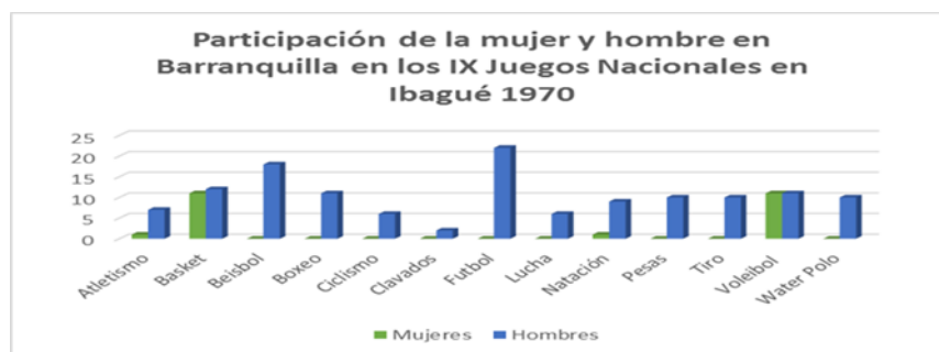
Gráfica I

Por consiguiente, podemos apreciar en las siguientes gráficas que evidencian la participación del género femenino y masculino que se ejercían para la década de los 70 en América y el Caribe, estos como los Juego Centroamericanos y el Caribe, en Panamá 1970, en 1974, República Dominicana y en 1978 Colombia-Medellín. Además, se realizaron los Juegos Nacionales en 1970, Ibagué, 1974, Pereira y 1980 en Neiva.