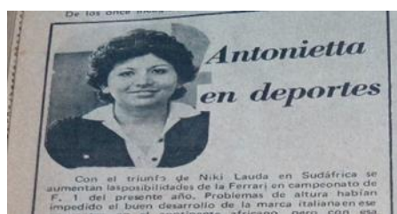
Imagen N 12, Periodismo deportivo femenino.